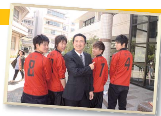
大学サッカー部のユニフォームに「感恩」の文字！

答えは明快、「小さいころからの夢だったから…」卒業生たちの頑張りや、われわれ教職員に大きな刺激、活力を与えてくれます。在学中の皆さんにとっても、頼もしく大きな頼れる存在です。