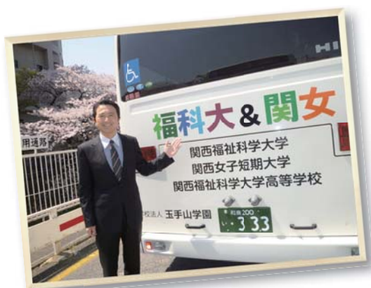
スクールバスがリニューアルしました

玉手山学園のビジョンの第一番目は、豊かな心と高い志の育成です。どうすればいい？ 難しく考える必要はありません。 笑顔、あいさつ、優しさを大切に、仲間たちと夢を語り合う ことがその出発点です。この基本、当たり前のことをぜひ実践してみましょう、爽やかな気持ちになれますから。このことはわれわれ大人にも全く共通していえること、いくつになってもいつまでも大事なことなのです。玉手山学園の 学生や教職員 といえば「 笑顔とあいさつ 」がまず思い浮かぶ、そうならばとても素晴らしいと思います。ぜひみんなで、目を輝かせ夢を語り合う豊かな学園生活を送りましょう。 学生のみなさんは、未来社会の宝物 です。