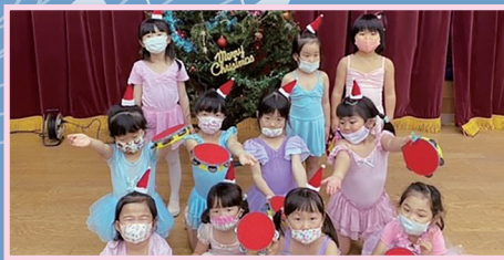
▲幼稚園 Mai Ballet Studio リトミックバレエクラス