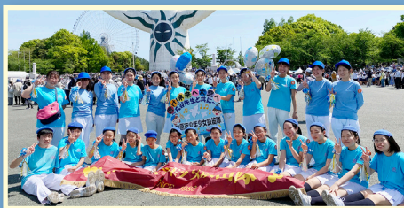
▲柏原市少年少女鼓笛隊