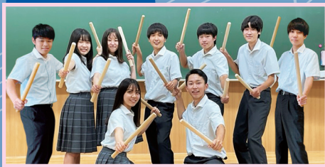
▲高校 和太鼓同好会