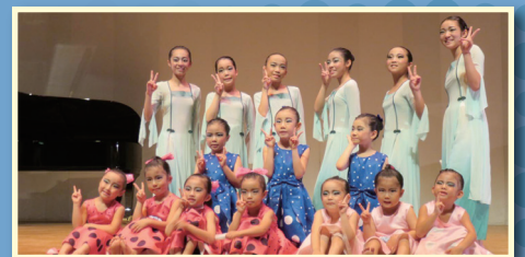
▲シラ ダンス スペース