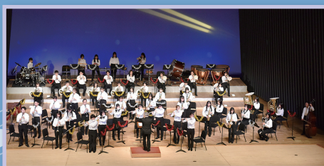
▲玉手山学園 吹奏楽団