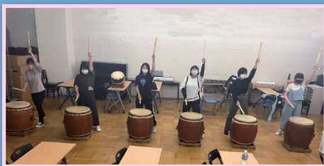
▲短大 和太鼓クラブ (鼓魂)