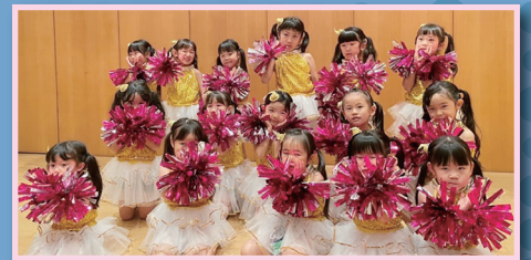
▲幼稚園 あおい新体操クラブ