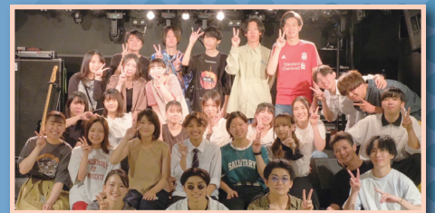
▲大学 軽音サークル